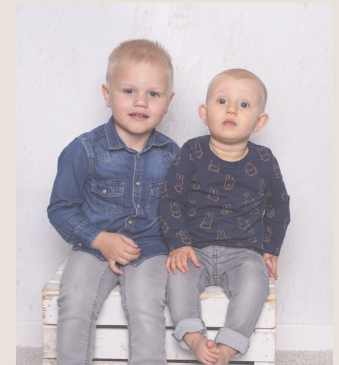
Boef & co.